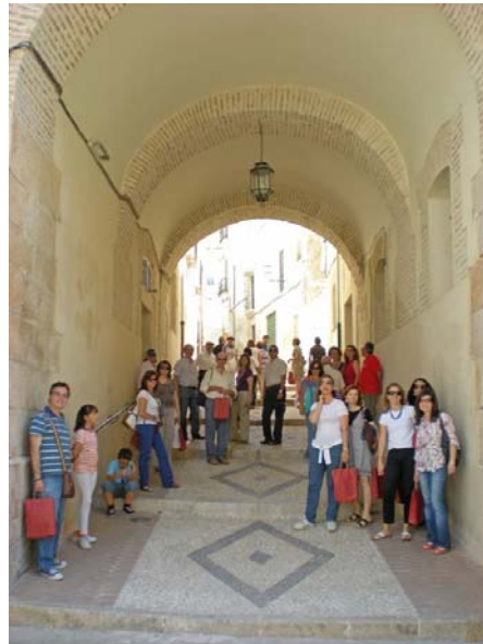
(Autor: Antonio Atienza)

plar la bóveda de cañón, de una sola nave, con lunetos y arcos fajones trilobulados, una bóveda semiesférica sobre pechinas decoradas con el anagrama de la Orden y coronada con un lucernario ochavado. De su patrimonio mueble hemos de destacar una joya, la Virgen del Fuelle, pieza renacentista del siglo XVI consistente en un fuelle decorado con un relieve adosado de la Virgen con el Niño, en madera tallada. Según la leyenda de su retablo fue rescatada en Flandes y donada al convento en 1736.